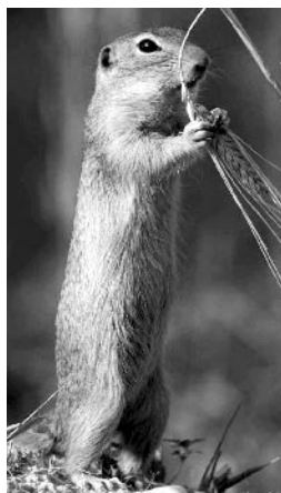
So sieht also ein Ziesel aus.