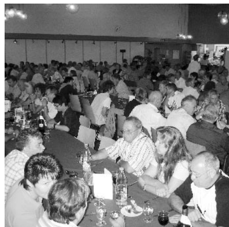
Gemütliches Ausklingen im Personalrestaurant.