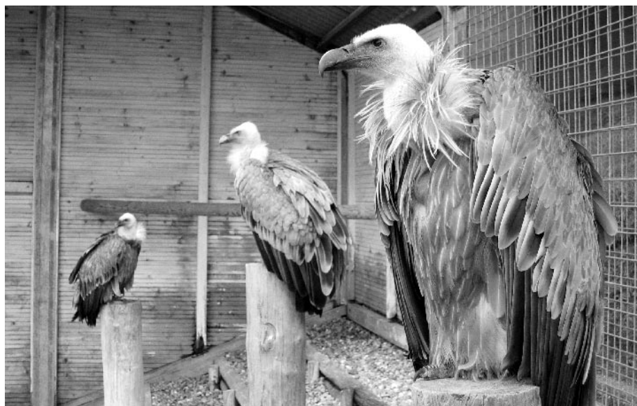
Auf dem Pfänder sind die Geier zum Greifen nah.

Um zwei Uhr kam es dann zu einem der Höhepunkte des Nachmittages, der Flugschau der Greifvögel. Jetzt wurde auch klar, warum die Reiseleitung in den Bussen mehrfach auf ein pünktliches Erscheinen pochte. Die Schau war bis auf den letzten Platz gefüllt. Und überall konnte man die weissen Ansteckbuttons der «Emser» sehen. Man staunte nicht schlecht, als der erste Wanderfalke über das Publikum hinwegschoss. Dieser Vogel erreichte die Geschwindigkeit eines Formel 1 Rennautos. Etwas gemächlicher – doch nicht